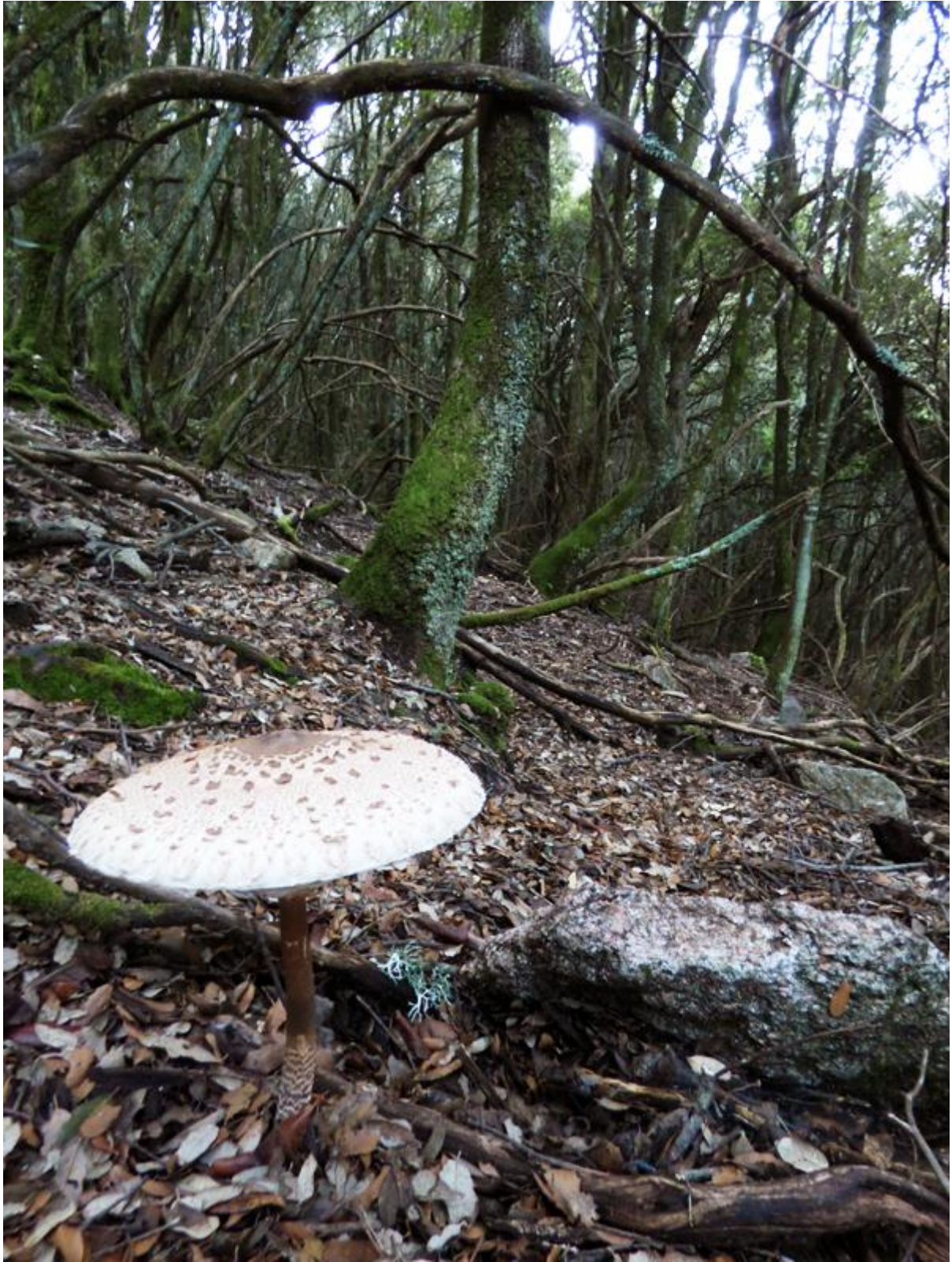
Un champignon !