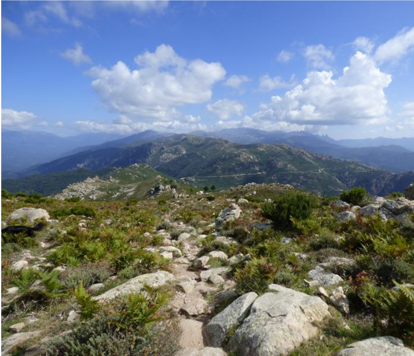
• En revenant vers le Col Saint-Eustache