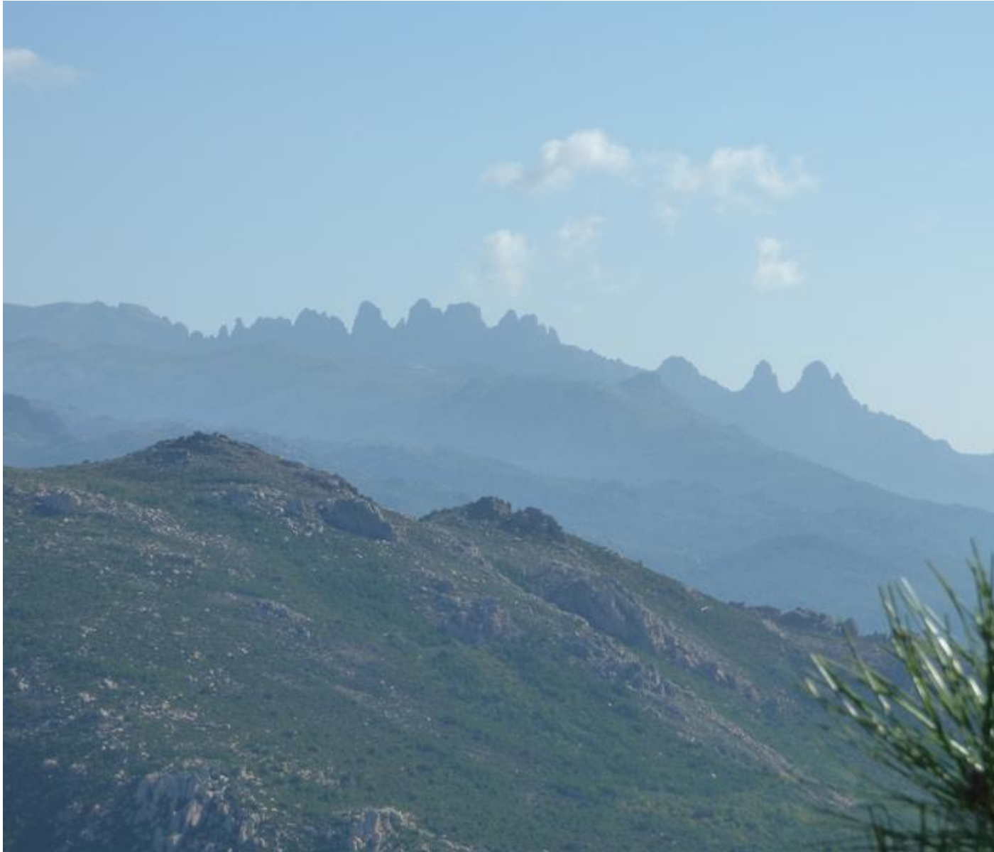
• Au fond les aiguilles de Bavedda