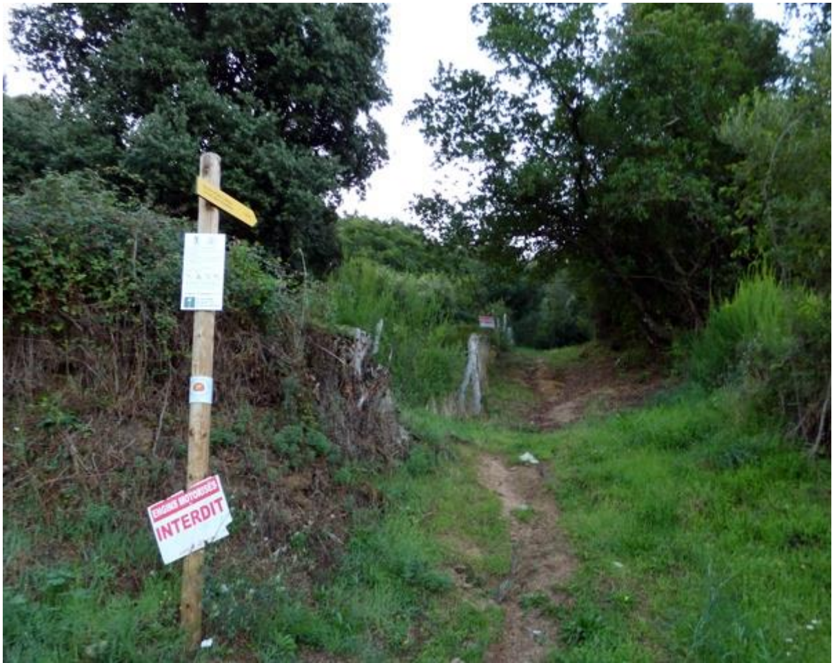
• Départ du sentier

Le Monte San Petru offre un panorama remarquable qui marque les esprits. Il a également été dans le passé le théâtre d'un événement tragique qui a laissé des traces sur le sommet.