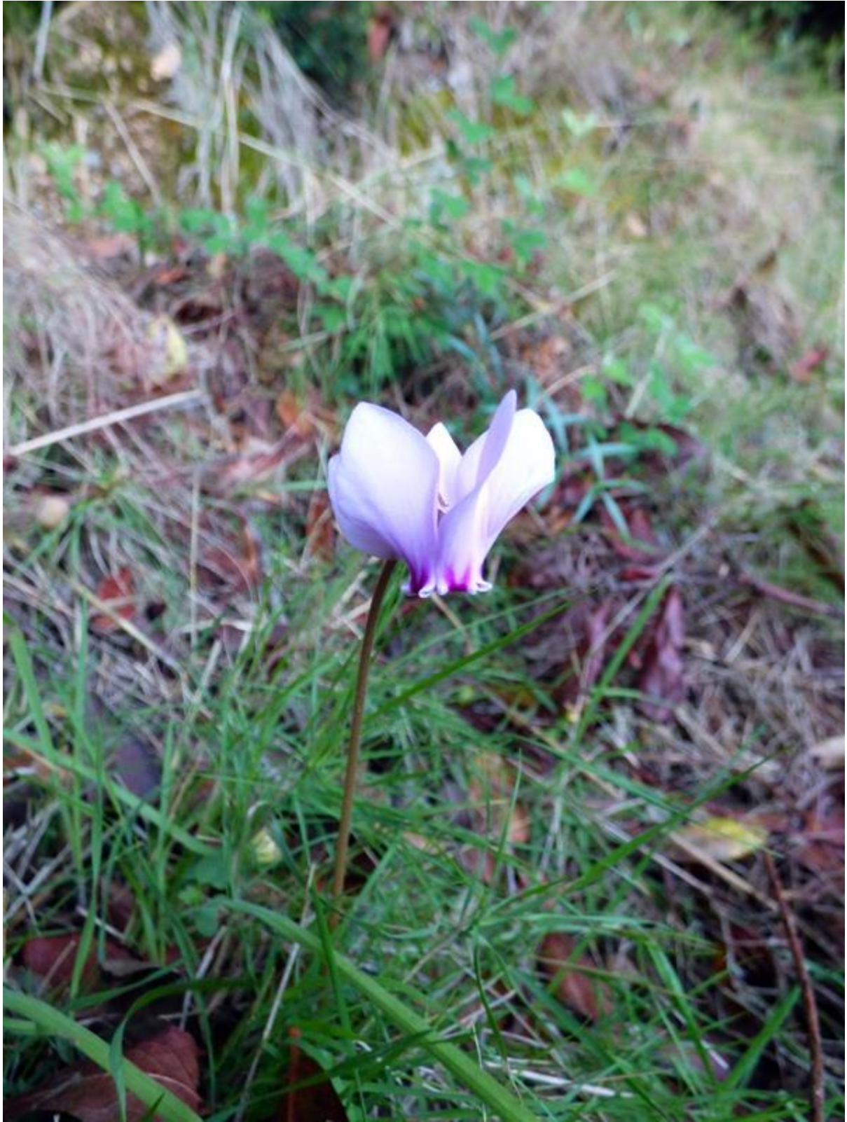
• Puis un crocus