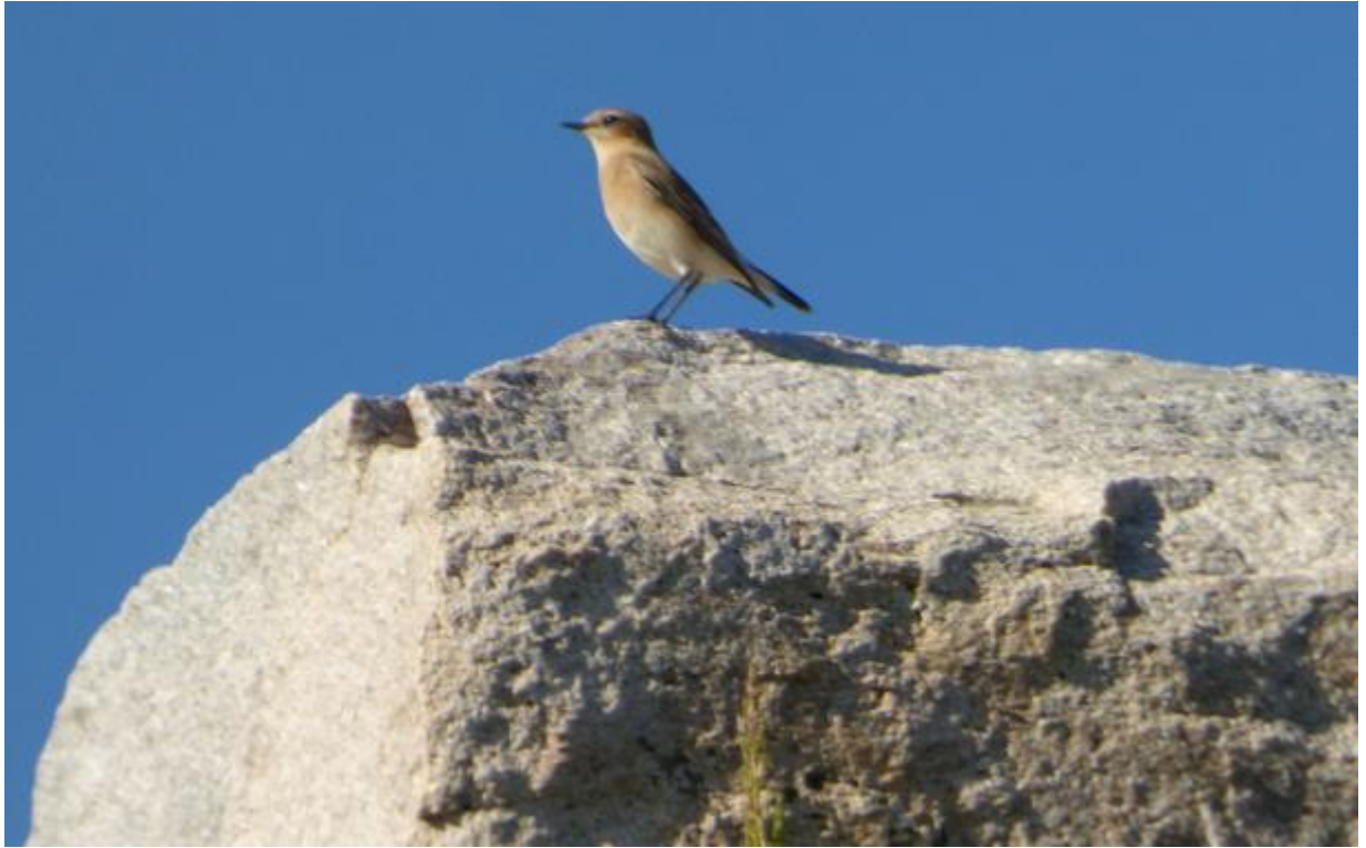
• Un oiselet...