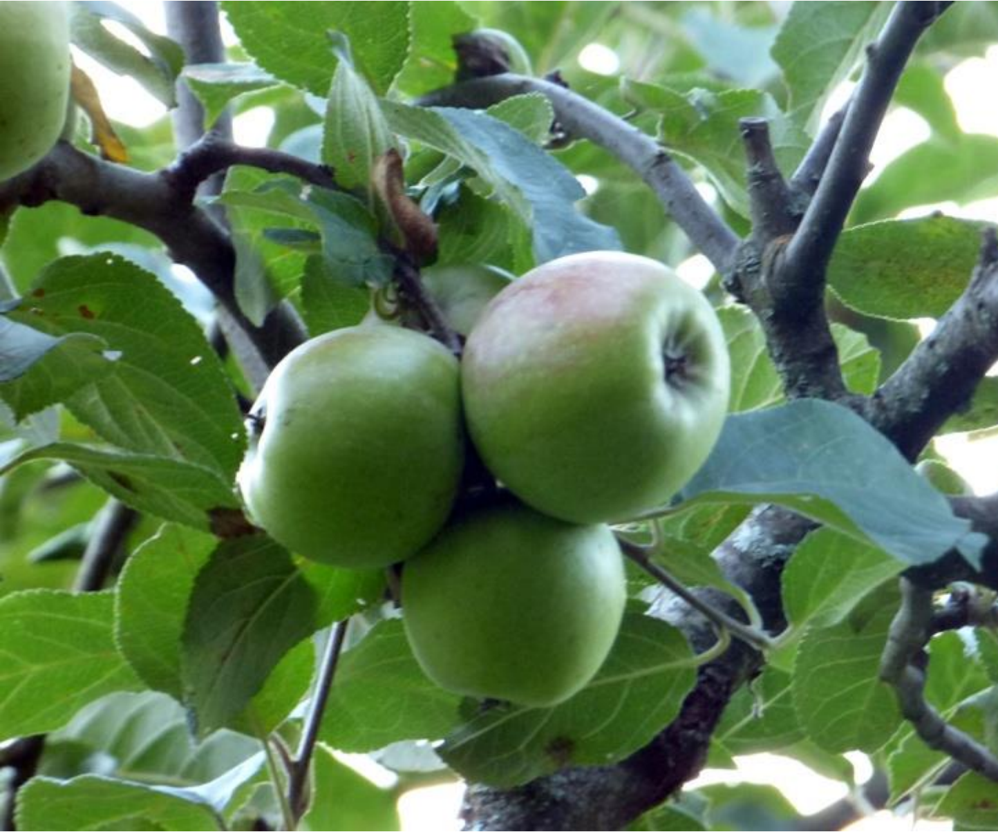
Voilà des pommes