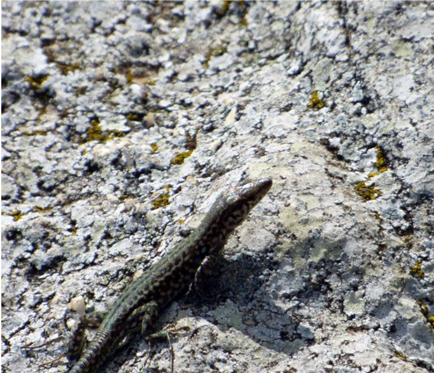
• Un lézard...