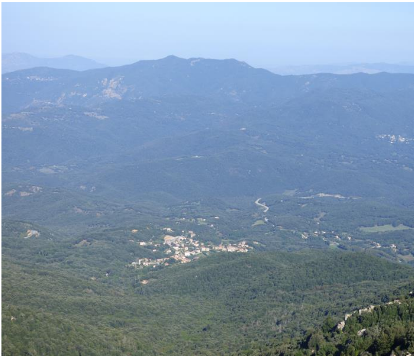
• Vue sur Pitretu è Bicchisgià