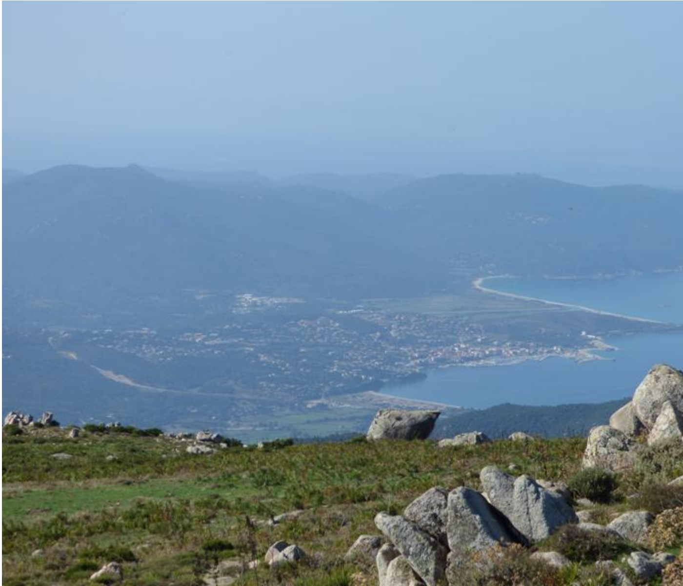
• Vue sur Prupia