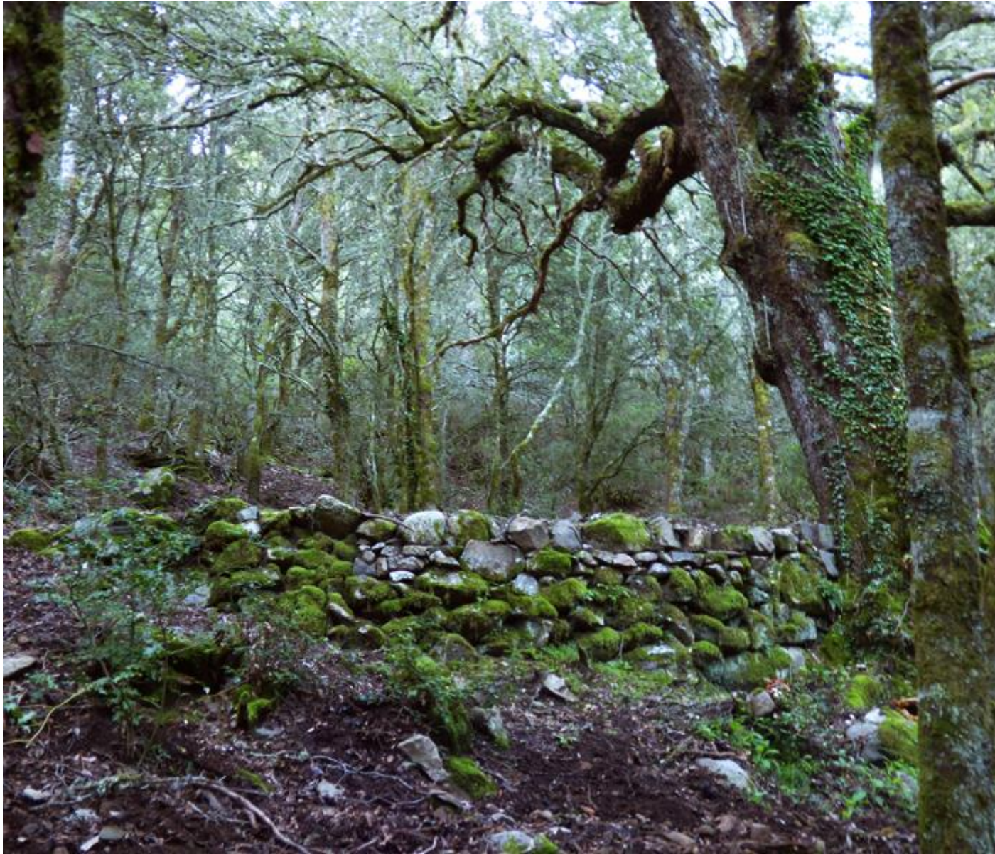
• Les restes d'une activité économique