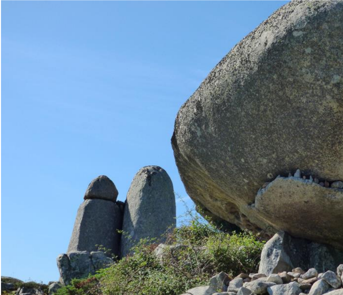
• Un rocher-requin?