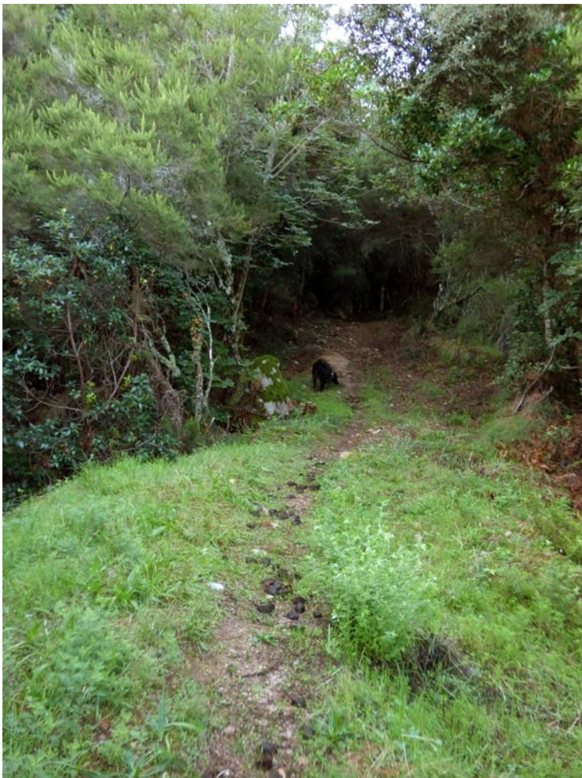
Au départ du sentier