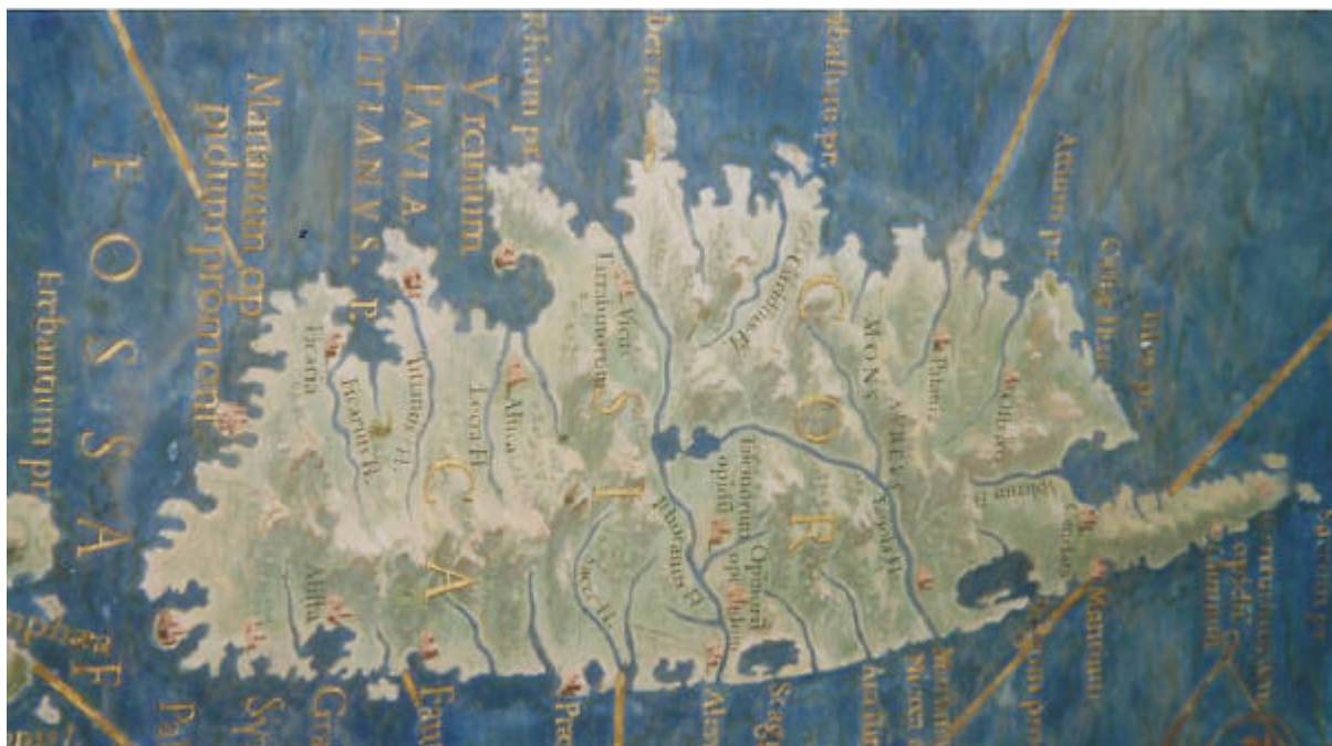
Museu di u Vaticanu. Sala di e carte.

Guidu Benigni. Campu Vallinu di PIGNA, Ottobre 2002.